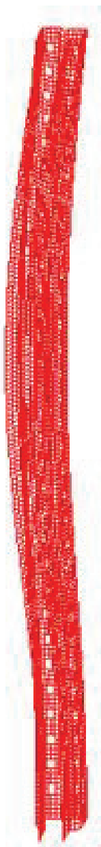
Рисунок 2. Форма потеря устойчивости