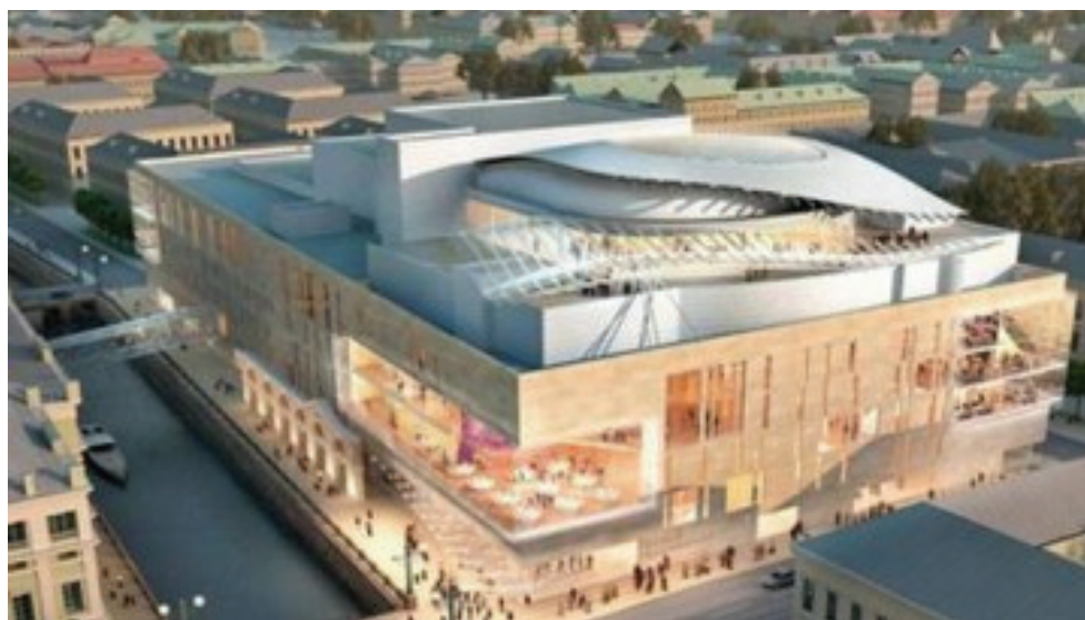
Рисунок 2. Модель здания второй сцены Мариинского театра

Очередной крупнейший инвестиционный проект в Петербурге – «Вторая сцена Мариинского театра» (рис. 2). Его стоимость оценивается в 250 миллионов евро. 500 миллионов предназначены на мероприятия по освобождению территории под строительство. Возведение второй сцены Мариинского театра проходит в рамках Государственной программы реставрации, реконструкции и расширения Мариинского театра. Программа предусматривает также реставрацию исторического здания театра: фасадов и зрительного зала с улучшением его акустических характеристик, модернизацию инженерных систем и сценического оборудования. Под строительство нового здания отведен квартал, расположенный к западу от существующего здания, на противоположном берегу Крюкова канала. Еще недавно строительство второй сцены Мариинского театра велось по проекту французского архитектора Доминика Перро.