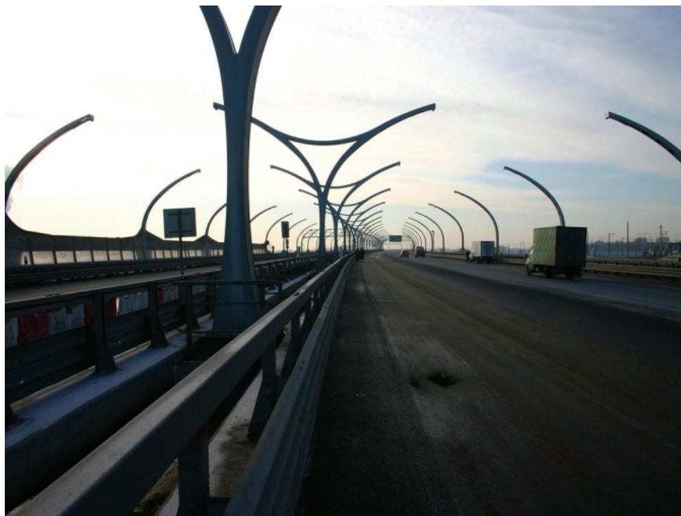
Рисунок 1. Шумозащитные экраны на ЗСД

Даже поэтапное введение в строй фрагментов этой автомагистрали приближает решение проблем организации внутреннего и транзитного потоков, пересекающих город в направлении «север – юг». Избавление центра города от транзитного транспорта позволит решить многие проблемы, в том числе и шумовую.